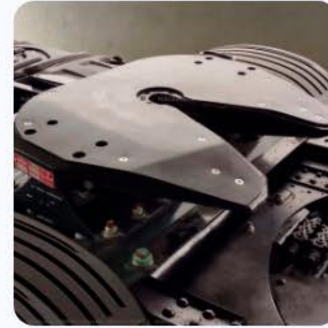
PROTETOR QUINTA RODA