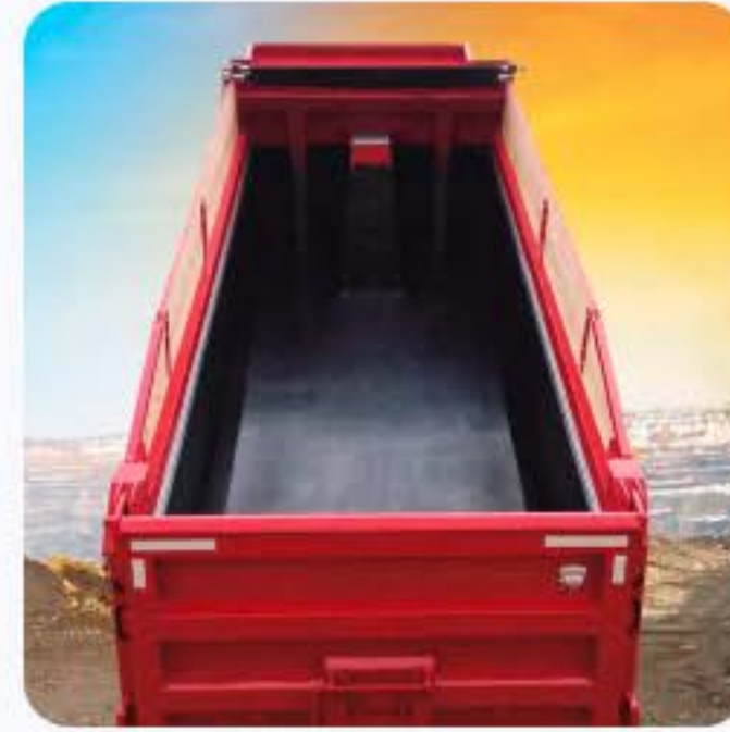
MANTA PARA CAÇAMBA