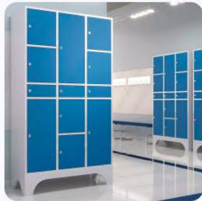
ARMÁRIO PARA VESTIÁRIO