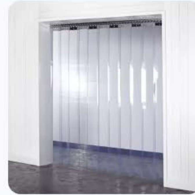
CORTINA DE PVC

Os principais produtos que temos no mercado