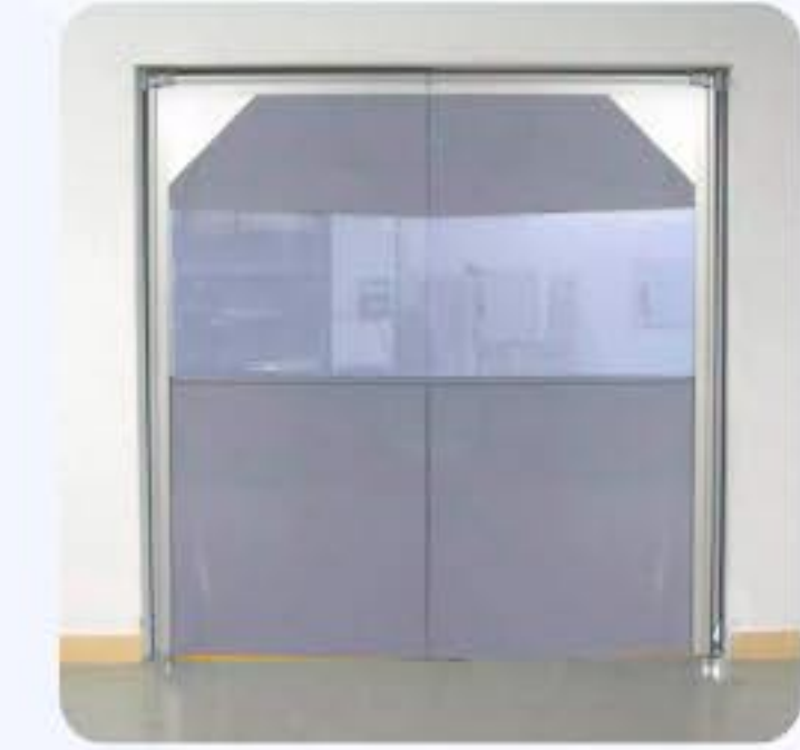
PORTA VAI E VEM PVC